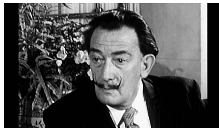
Le «divin» Dali (1904-1989)

Pourquoi ce libre-penseur, peintre génial et provocant, est-il revenu à la religion de son enfance? Pourquoi le «divin» Dali considérait-il Jésus comme du fromage coulant? Comment inter-