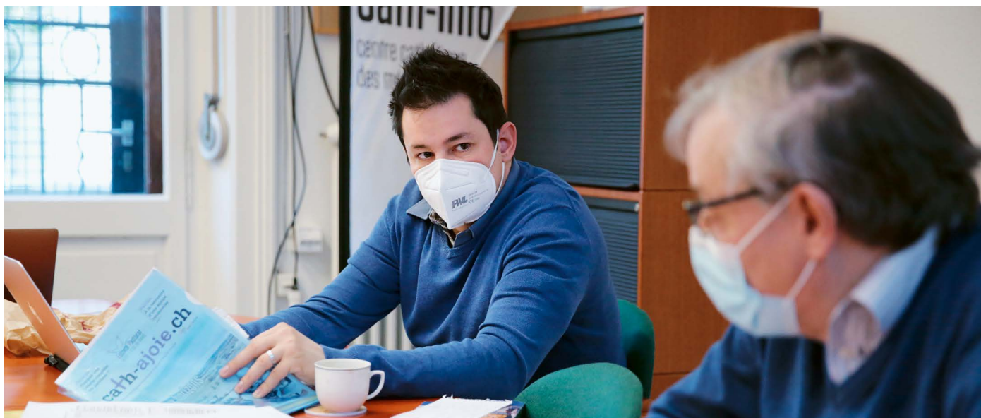
La rédaction à l’heure du briefing