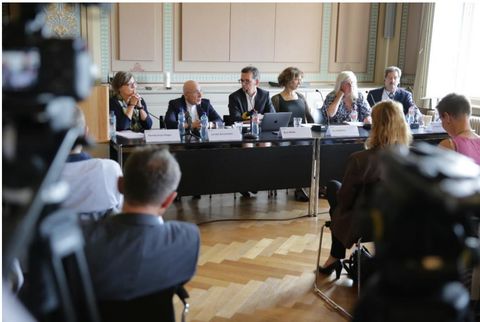
Présentation du rapport sur la gestion des abus en contexte ecclésial, à Zurich, le 12 septembre 2023.

Début octobre, le rideau s'est levé sur le premier acte du Synode sur la synodalité voulu par le pape François. La présence de Maurice Page à Rome la dernière semaine de la rencontre a permis de mieux saisir les enjeux de ce synode pas toujours bien compris des fidèles. Ce nouveau dossier (16'000 clics – une majorité des articles étant réservée aux abonnés) complète tout le travail de la rédaction sur la préparation du synode en Suisse, commencée fin 2021.