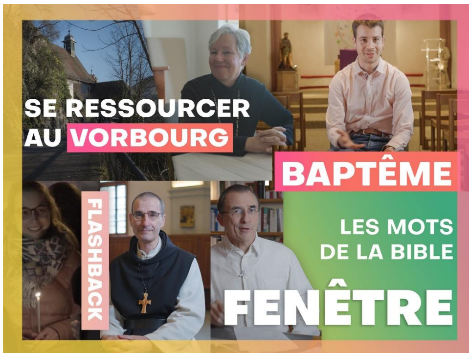
Aperçu de la production vidéo Camino, conçue par Pierre Pistoletti et visible sur les réseaux sociaux de cath.ch.

Cath-Info a signé avec Pierre Pistoletti le projet « Camino ». En gestation depuis le printemps, il a commencé à l'automne à produire pour les réseaux sociaux de cath.ch. Citations, reels, explainers, capsules, reportages, interviews, etc. Autant de formats digitaux décryptant l'Eglise et donnant la parole à ceux qui la font vivre, destinés au site cath.ch et à ses réseaux sociaux.