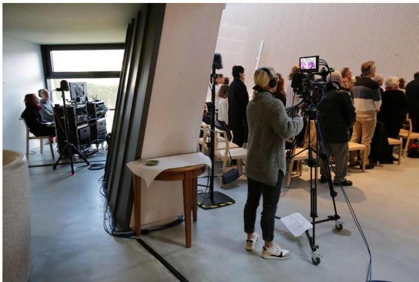
Messe télévisée sur RTS 2 à Gland.

L'année 2023 a inauguré 6 messes dites 'light' sur RTS 2. Des messes radio filmées à travers la Suisse romande et diffusées à 10h sur la deuxième chaîne romande. Cath-Info a confié la réalisation image à Fabrice Junod de la société Cleanfeed. La production a misé sur la diversité cantonale et rendez-vous liturgiques : Le Dimanche des Malades à Gland (VD), La Trinité au Vorbourg (JU), la Fête-Dieu à La Chaux-de-Fonds (NE), La Semaine romande de musique et de liturgie (SRML) à St-Maurice (VS), le Dimanche de la Mission à Saint-Gingolph (VS) et La fête du Christ-Roi à Remaufens (FR).